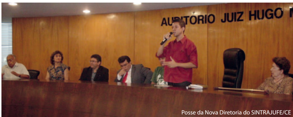
Posse da Nova Diretoria do SINTRAJUFE/CE

A nova diretoria do SINTRAJUFE/CE também está preocupada com a melhoria da estrutura da entidade, fundamental para nossa atuação. Foi nesse sentido que realizamos a contratação de um estagiário do curso de sociologia para o sindicato e readequamos o layout da sala no 4º andar do Edifício Sede da JF/CE, ganhando mais espaço e iluminação para o local. Efetuamos, ainda, o descarte de considerável volume de material inútil acumulado na sala já pequena, de forma a tornar o espaço mais agradável para os sindicalizados. Nesse mesmo sentido, acertamos com a diretoria do foro para que fosse retirado da sala sindicato o serviço de entrega de boletins impressos a assinantes, que nada tinha a ver com o SINTRAJUFE/CE. O espaço físico adicional obtido a partir dessas iniciativas simples, que só dependiam de boa vontade, agora nos permite oferecer ao filiado um local com jornais, revistas e outras publicações de contraponto à orientação anti-servidor e anti-trabalhador da mídia hegemônica. Em breve também estaremos providenciando uma nova pintura para a sala do sindicato, eis que a atual se encontra um tanto desgastada. Outro encaminhamento da Gestão Unidade na Luta é a avaliação pelo Conselho Deliberativo